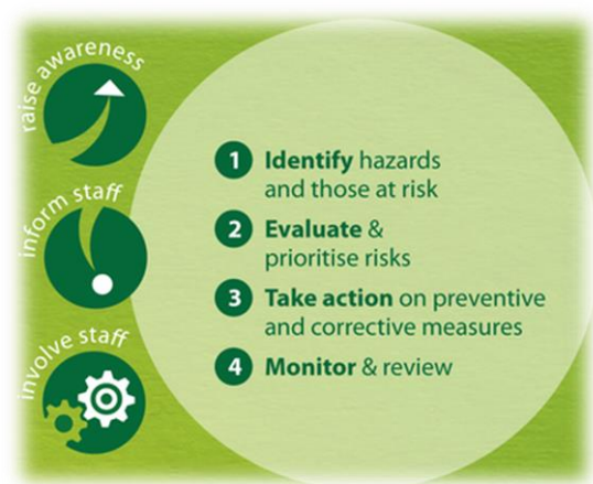
1. ábra EU-OHSA ajánlás 2014-es kampány

A Stressz-M kérdőívből úgy készült diagnosztikai eszköz, hogy egy meghatározott módszertanba illesztettük az EU-OHSA (Európai Munkahelyi Biztonsági és Egészségvédelmi Ügynökség) és ajánlását figyelembe véve. Az EU-OHSA egy 4 lépéses módszert ajánl a pszichoszociális kockázatok felmérésére.